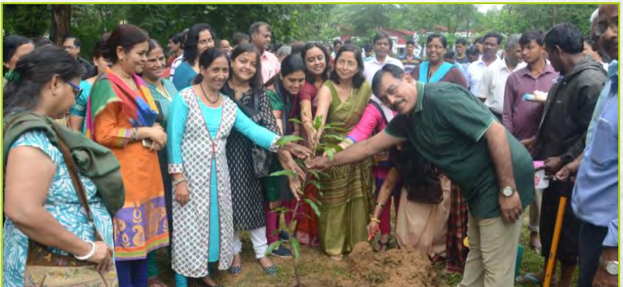
Plantation Drives in Township by CMD, other Employees & their Family Members