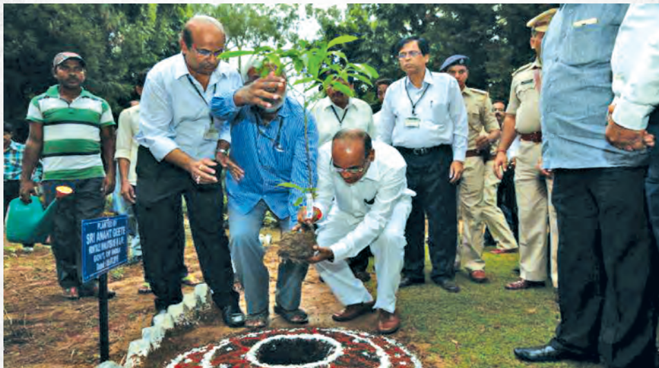
Tree plantation by Shri Anant Geete, Hon'ble Union Minister of Heavy Industries and Public Enterprises on 08.07.2015