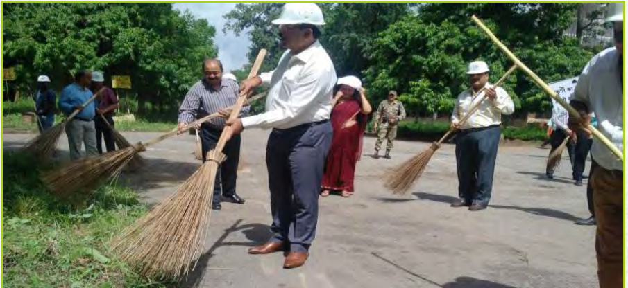
CMD Leading the Cleaning Campaigns in Factories